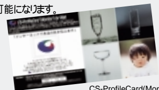
CS-ProfileCard(Monitor) プロファイルカード

CS-ProfileCardは、トッパンが開発した画期的なモニタプロファイル作成ツールです。ユーザは、基準となるこのCS-ProfileCardとトッパンのCCTサーバから送られてくる画像を見比べながらモニタプロファイルを作成していきます。人間の色感覚を基準とした目視評価システムで、調整が簡単。専門的な知識や特別な装置を持っていないユーザにも、モニタプロファイリングが可能になります。